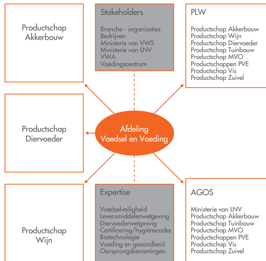
Figuur: Afdeling Voedsel en Voeding

De afdeling Voedsel en Voeding is gespecialiseerd in levensmiddelen- en diervoederwetgeving, certificering, oorsprongsbenamingen en alle aspecten rondom voeding en gezondheid van levensmiddelen (figuur: Afdeling Voedsel en Voeding). Op deze kennisvlakken ondersteunt de afdeling Voedsel en Voeding het Productschap Akkerbouw, het Productschap Diervoeder en het Productschap Wijn bij de uitvoering van haar werkzaamheden. De afdeling houdt zich bezig met de nationale, Europese en wereldwijde levensmiddelenwetgeving (de Codex Alimentarius). Dit gebeurt grotendeels onder de vlag van de Productschappencommissie Levensmiddelenwetgeving (PLW, zie kader). Dit betekent dat de afdeling alle productschappen informeert over de ontwikkelingen op het gebied van de levensmiddelenwetgeving en vragen en reacties behandelt van de productschappen en hun achterban.